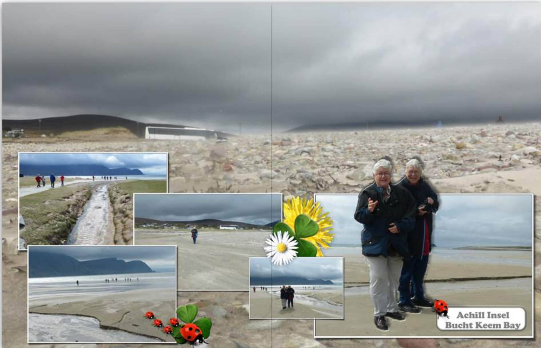
Achill Insel Bucht Keem Bay