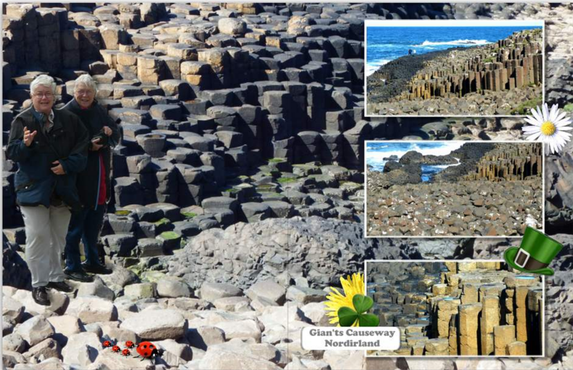
Gian'ts Causeway Nordirland