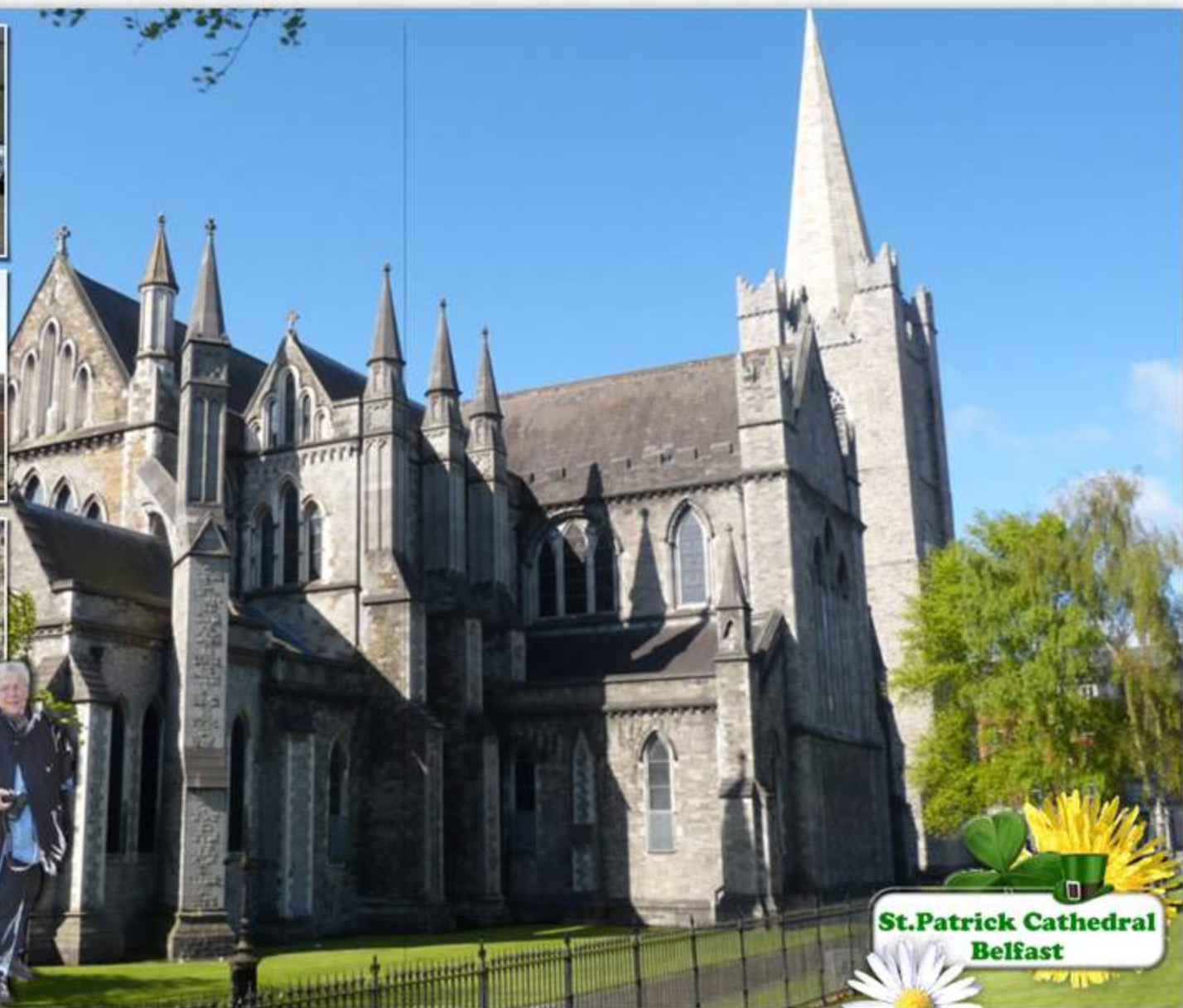
St. Patrick Cathedral Belfast