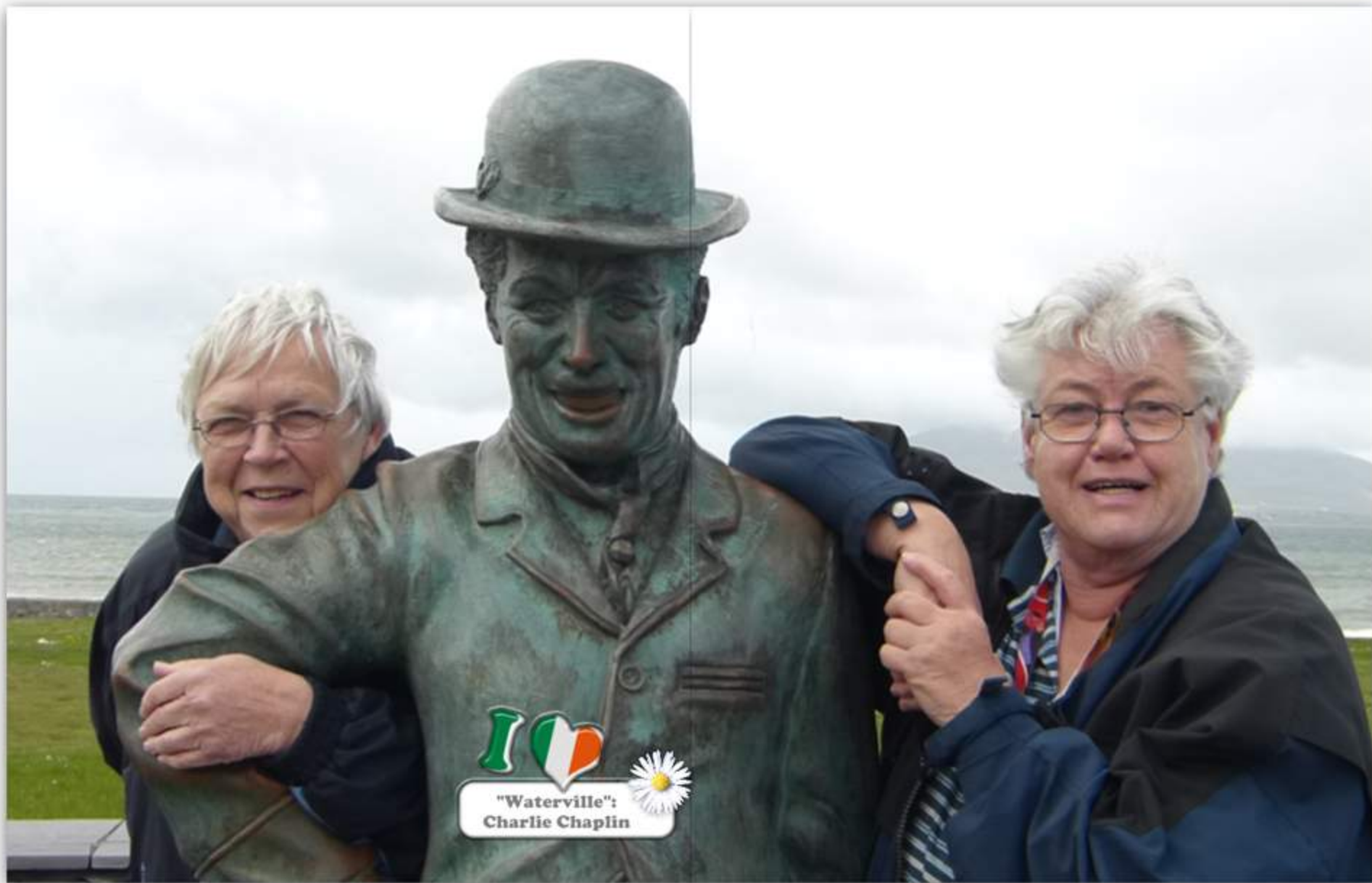
I Love Ireland "Waterville": Charlie Chaplin