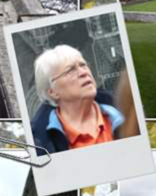
Rock of Cashel