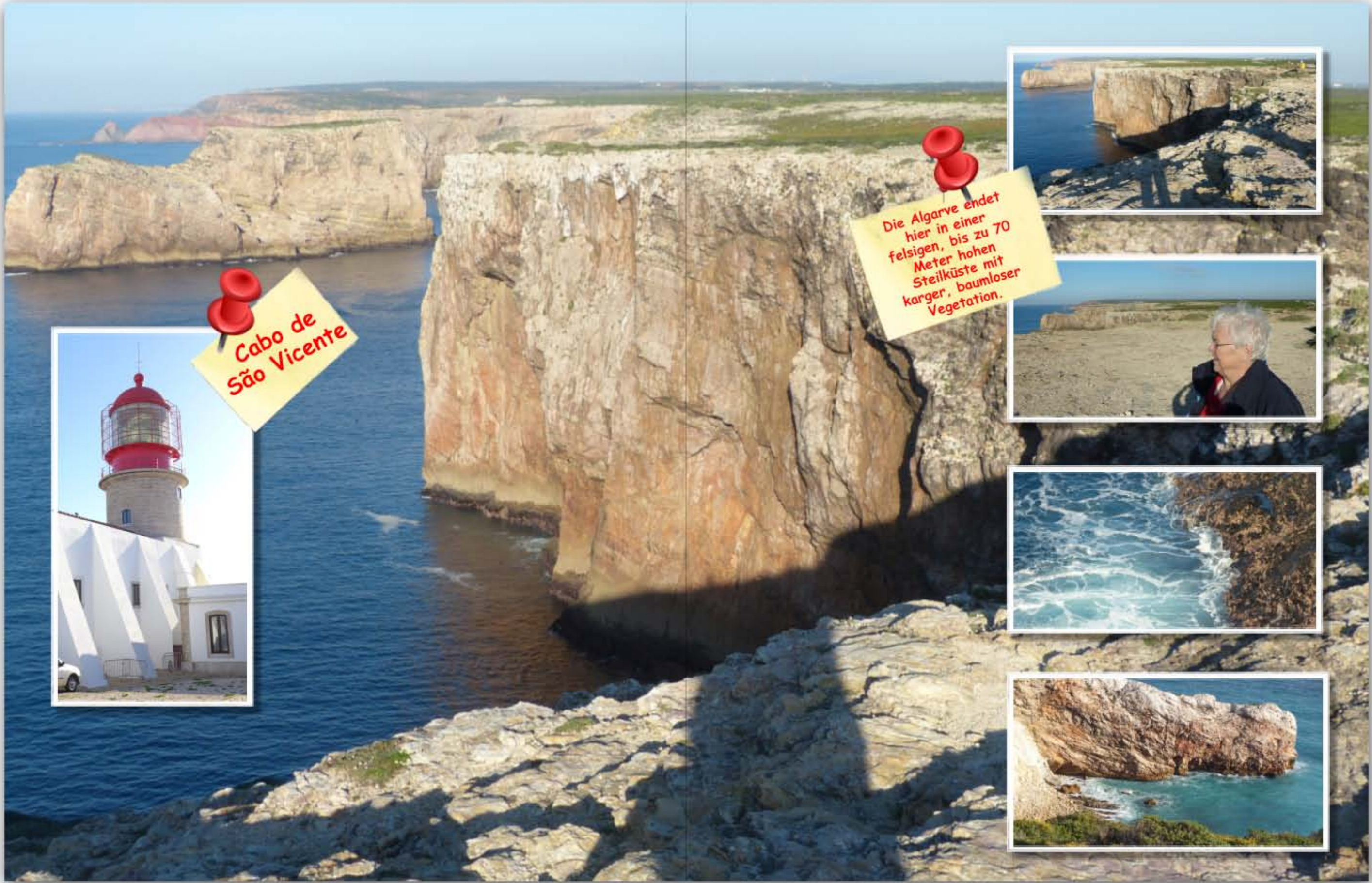
Cabo de São Vicente