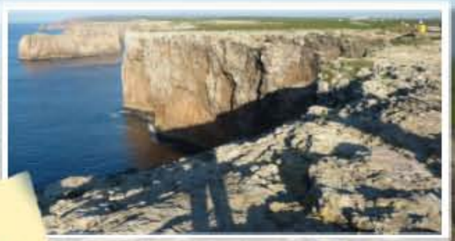
Die Algarve endet hier in einer felsigen, bis zu 70 Meter hohen Steilküste mit karger, baumloser Vegetation.