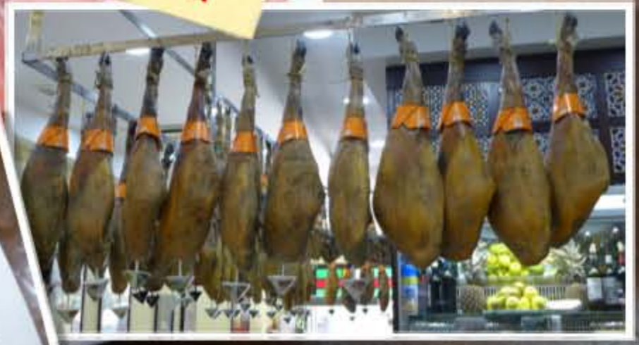
Serano + Iberico Schinken