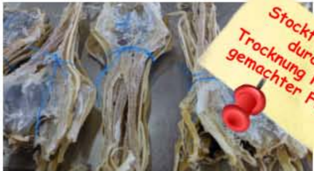
Stockfisch ist durch Trocknung haltbar gemachter Fisch.