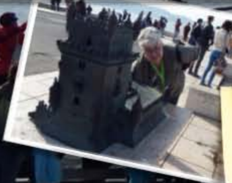
Torre de Belém Lissabon