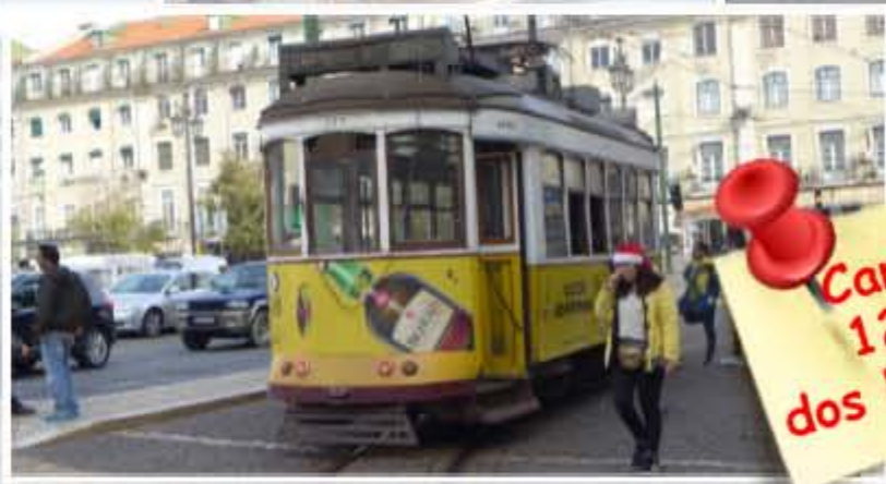
Carreira 12 (28) dos Eléctricos