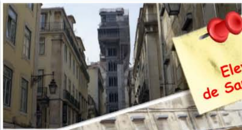
Elevador de Santa Justa