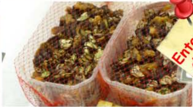
Entenmuscheln, die eigentlich Krebse sind!